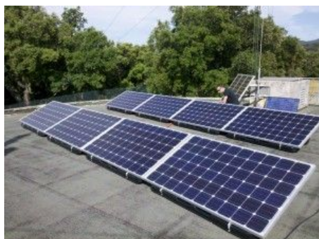
Installation au sol

SFE conçoit elle-même ses packs batteries Lithium et peut donc coller au mieux de vos impératifs en terme d'encombrement.